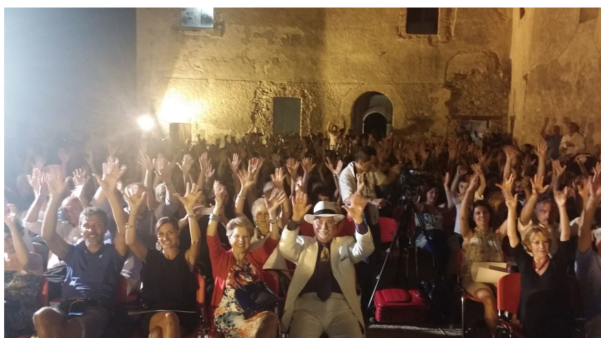
Il saluto Federiciano dei partecipanti al Festival